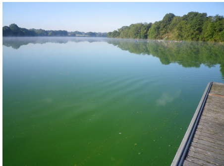
Niveau alerte 2+