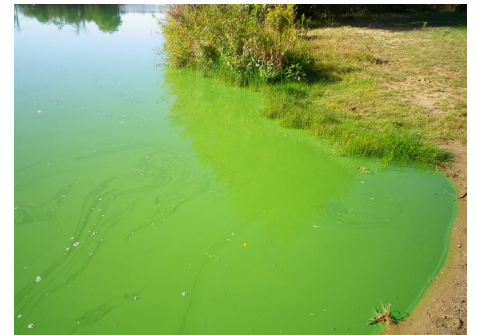
Niveau alerte 3