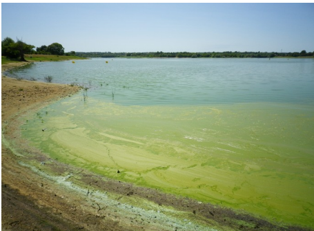
Niveau alerte 2