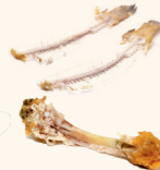
Les résidus alimentaires