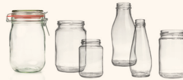
Les bocaux, les pots, les flacons