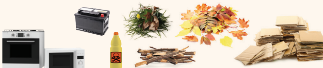
Batteries / Bois traité / Cartons / Déchets verts / Gravat / Films plastiques Plastiques durs / Huiles minérales et végétales / Piles / Tout-venant / Mobilier Déchets d'équipements électriques et électroniques Déchets dangereux spécifiques / Objets à destination du réemploi