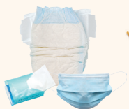
Les produits à usage unique et non recyclables