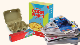
Les papiers et les cartonnettes