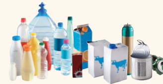
Les emballages en plastique, métalliques, et les briques alimentaires