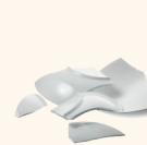
La vaisselle et le verre cassés