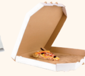
Les emballages souillés