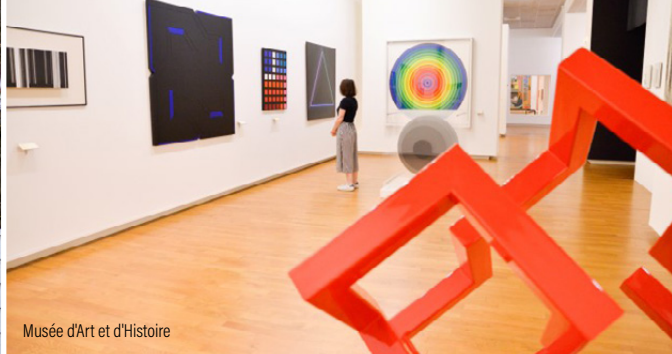
Musée d'Art et d'Histoire