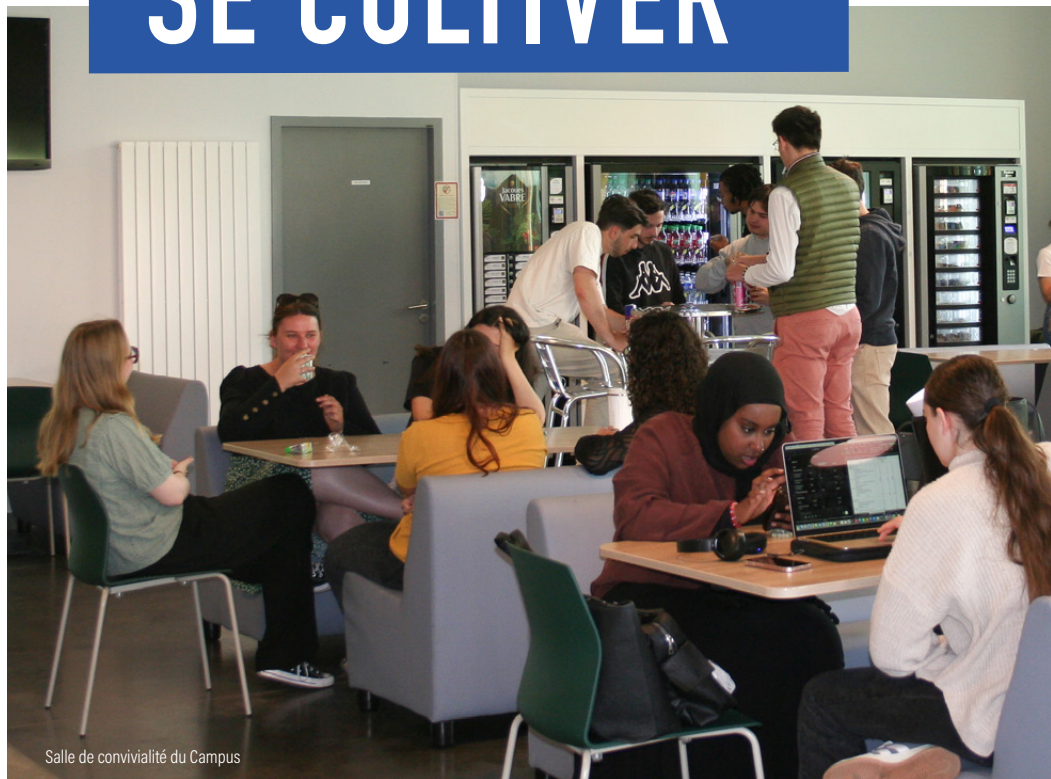
Salle de convivialité du Campus