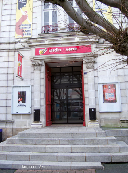
Jardin de Verre