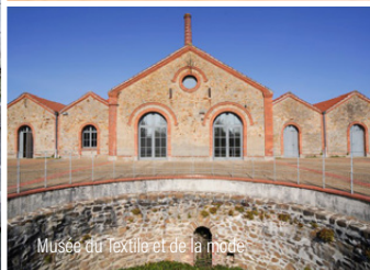
Musée du Textile et de la Mode