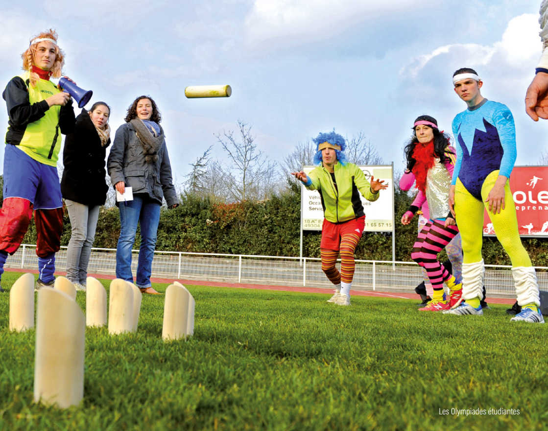
Les Olympiades étudiantes