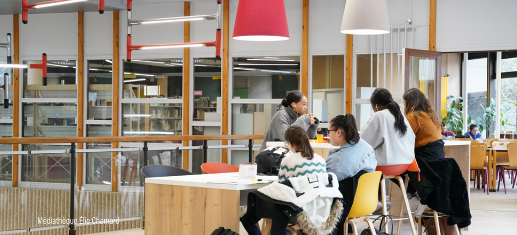
Médiathèque Élie Chamard