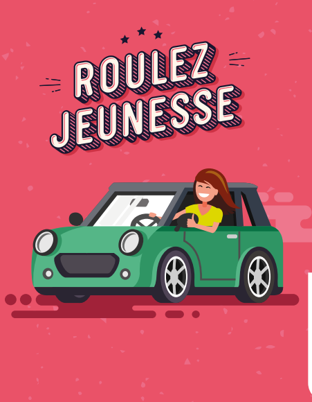
Direction de la Communication - Cholet, Ville et Agglomération - décembre 2025

Dans le cadre du suivi des candidats dans ce dispositif, la Ville de Cholet est susceptible de les contacter pour leur proposer de participer à des campagnes de communication. La participation à ces événements est conditionnée au consentement du candidat (en cochant la case dédiée du dossier de candidature).