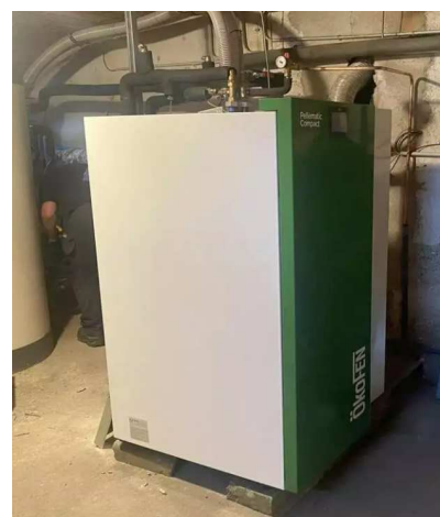
Saint Christophe du Bois - Installation d'une chaudière bois comme moyen de chauffage de la mairie