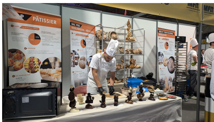
Cholet - Carrefour de l'orientation