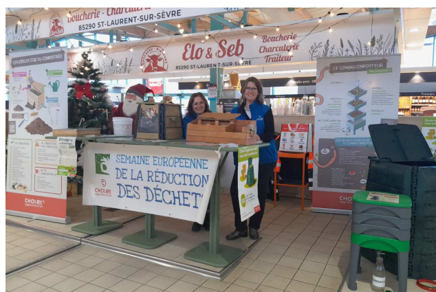
Cholet - Sensibilisation au compostage lors de la semaine européenne de la réduction des déchets