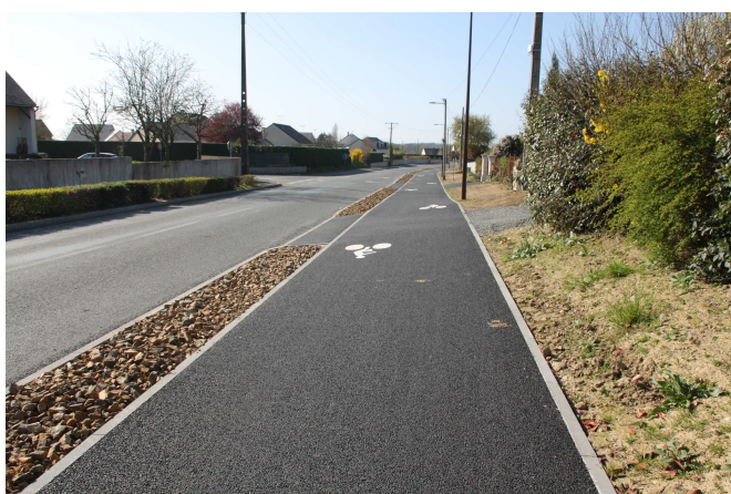
Montilliers - Création d'une piste cyclable reliant l'entreprise Grolleau et la rue du stade