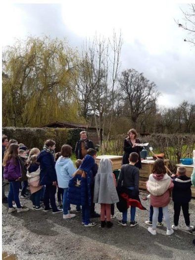
Saint-Paul-du-Bois – Installation d'un compost à la cantine scolaire