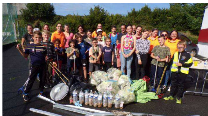
Maulévrier - Ramassage des déchets sur l'espace public