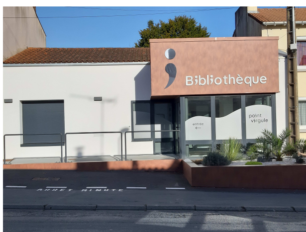
La Romagne - Réhabilitation de l'ancien trésor public en bibliothèque