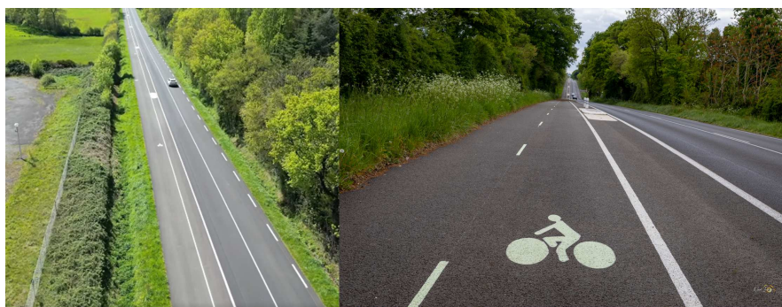
Nuaillé - Réalisation d'une piste cyclable entre Nuaillé et Cholet