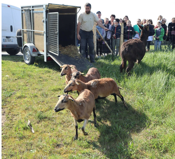
Saint Léger sous Cholet - Eco-pâturage