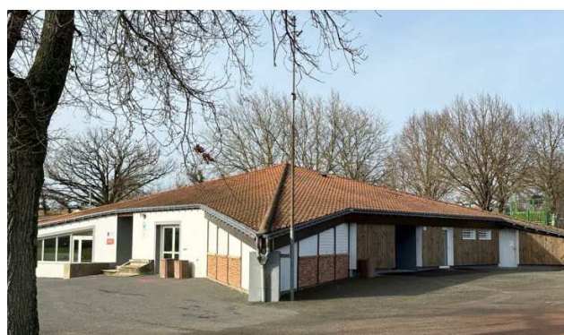
La Segunière - Rénovation énergétique des vestiaires du stade