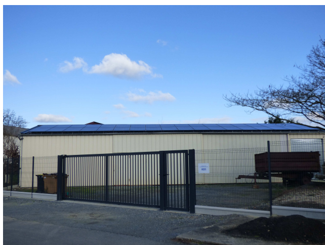
Cernusson – Installation de panneaux photovoltaïques en autoconsommation collective sur le local technique