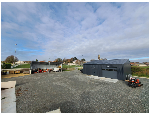
Mazières en Mauges – Construction d'un centre technique municipal