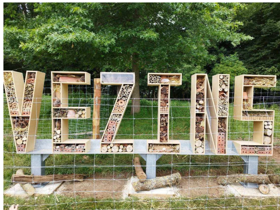
Vezins – Création d'un hôtel à insectes