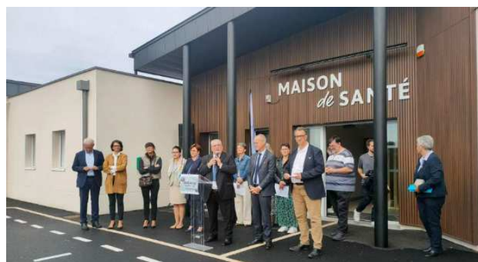
Coron – Création d'une maison pluridisciplinaire de santé