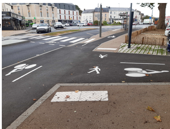
Figure 1: Boulevard Jeanne d'Arc