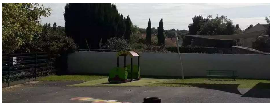
Trémentines - Végétalisation de la cour de l'école maternelle