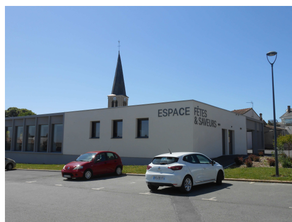
La Plaine - Réhabilitation de la salle des fêtes