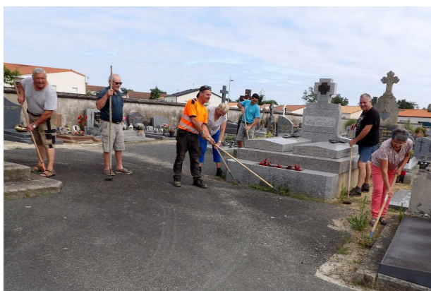
Yzernay – Entretien du cimetière par une équipe de bénévoles