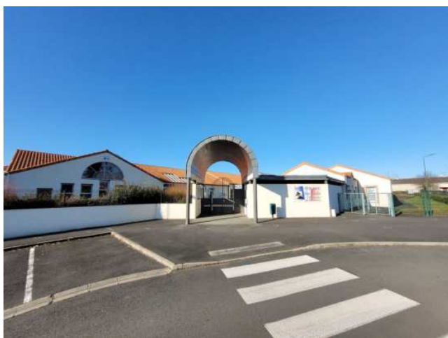
Le May sur Evre – Rénovation énergétique de l'école publique