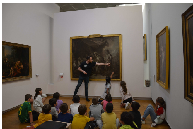
Cholet - Visite des musées par les scolaires