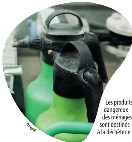
Les produits dangereux des ménages sont destinés à la déchèterie.

Potentiellement explosifs, corrosifs, toxiques, irritants et facilement inflammables, ils ne doivent en aucun cas être jetés dans la nature, sur les sols, ni même dans les réseaux d'assainissement. Pour autant, ils ne doivent pas davantage être déposés dans les bacs de collecte. Dès lors qu'ils sont mélangés aux ordures ménagères, ils sont une menace pour les personnes en charge de la collecte et un risque pour les installations de traitement. Au regard des dangers qu'ils présentent, ces produits doivent être apportés en déchèterie, où des espaces spécifiques sont prévus pour leur dépôt sécurisé. Toutes les déchèteries du territoire de Cholet Agglomération en disposent. Dans le détail, les produits concernés sont les peintures, vernis, colles, solvants, produits d'entretien et de jardinage (pesticides, engrais et autres produits phytosanitaires tels qu'insecticides, herbicides, désherbants, anti-nuisibles, fongicides, etc.), aérosols et cartouches de gaz, huiles de vidange et liquides de refroidissement ainsi qu'acides, bases et produits chimiques divers.