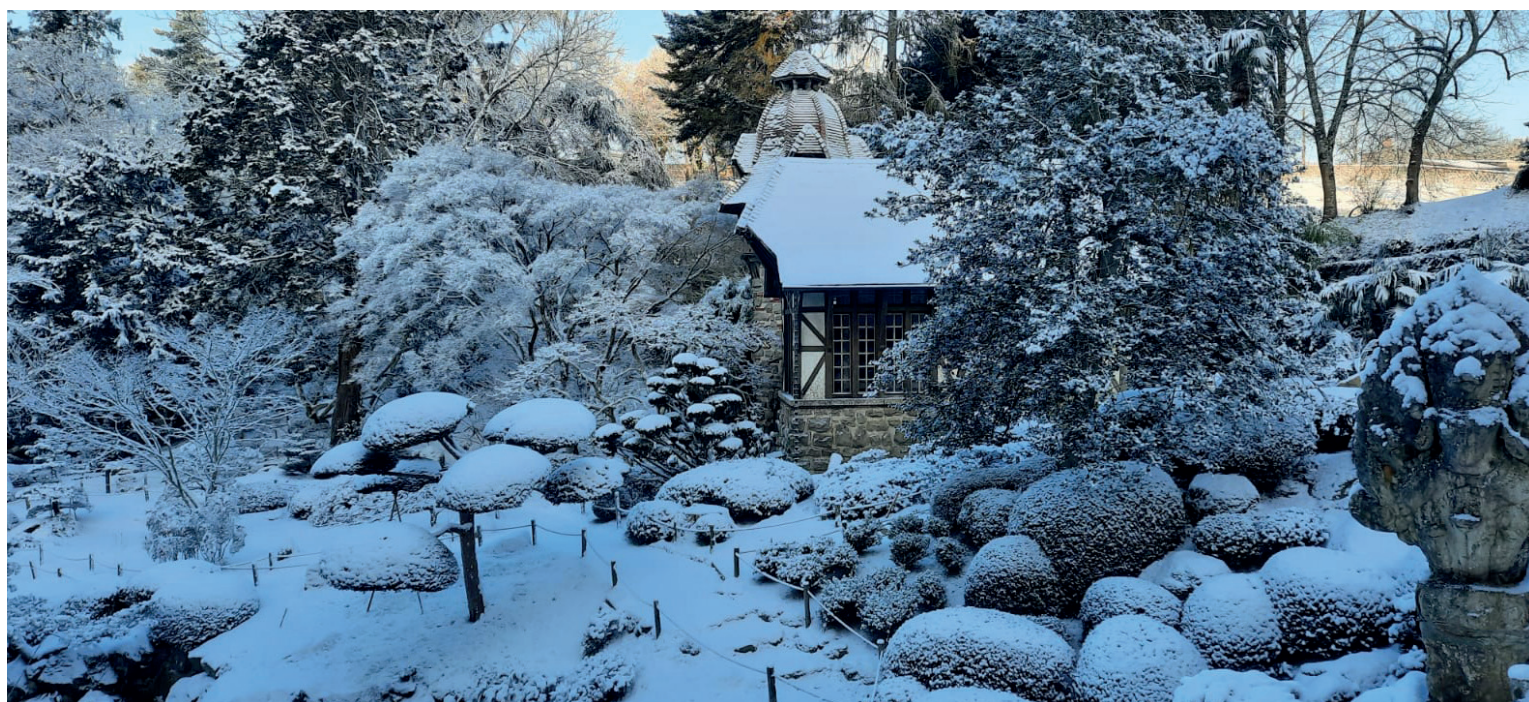
Parc oriental de Maulévrier