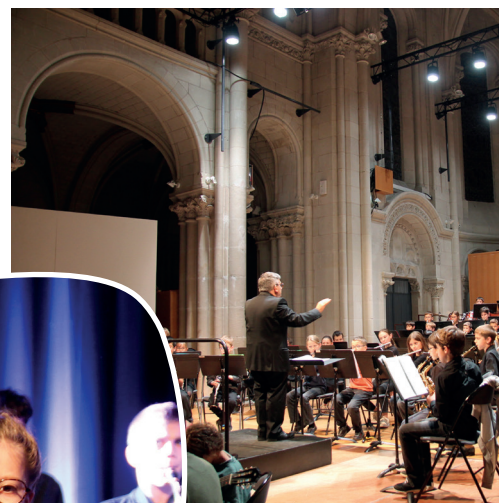
Trois jours de concerts et représentations !

Enfin, le concert se conclura par une pièce en commun regroupant l'ensemble instrumental à vent et l'orchestre d'harmonie, pour un moment de partage musical célébrant l'énergie et le plaisir de jouer ensemble.