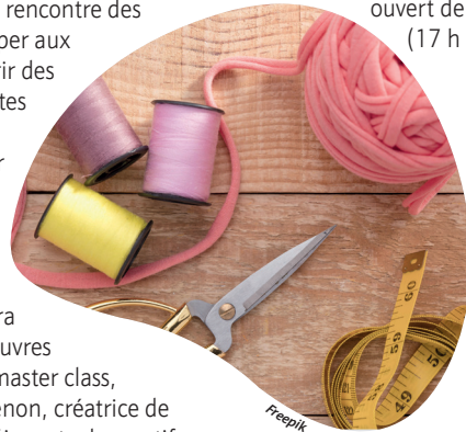
Les arts du fil sont à l'honneur pendant quatre jours.

Par ailleurs, une grande exposition de quilts traditionnels sera présentée. Quant au pôle commercial, il sera riche de fournitures, accessoires, petit matériel, machines à coudre et à broder, créations, laines, tissus, kits créatifs, mercerie, modèles, patrons et tutoriels, fils, toiles, livres, etc. Le salon, se tenant au parc des expositions de la Meilleraie, du jeudi 22 au dimanche 25 janvier, est ouvert de 10 h à 18 h (17 h le dimanche).