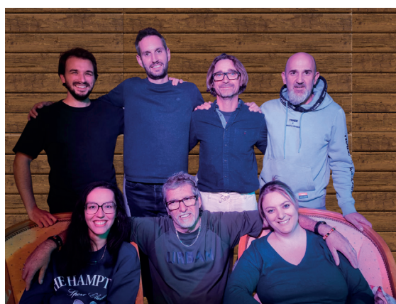
Petit théâtre de l'impasse