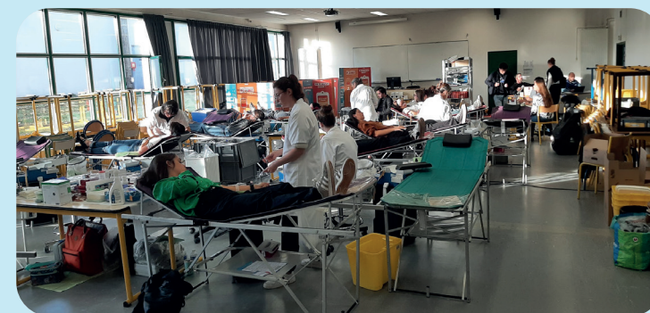
L'association de don de sang bénévole de Cholet organise six collectes par an.

Ils auront installé les différents espaces, réuni brioches, biscuits et autres chocolats auprès de leurs partenaires puis préparé les collations offertes après les prélèvements et seront prêts à accompagner avec bienveillance les donneurs. Aux côtés des médecins et infirmiers de l'établissement français du sang (EFS), la vingtaine de volontaires de l'Association de don de sang bénévole de Cholet sera de nouveau sur le pont, ce samedi 24 janvier, de 8 h 15 à 12 h 15, à la salle Mocrat, pour la première collecte mobile de 2026. « Nous en organisons six par an, afin de respecter le délai de huit semaines entre deux prélèvements pour nos donneurs les plus fidèles. Et il y a