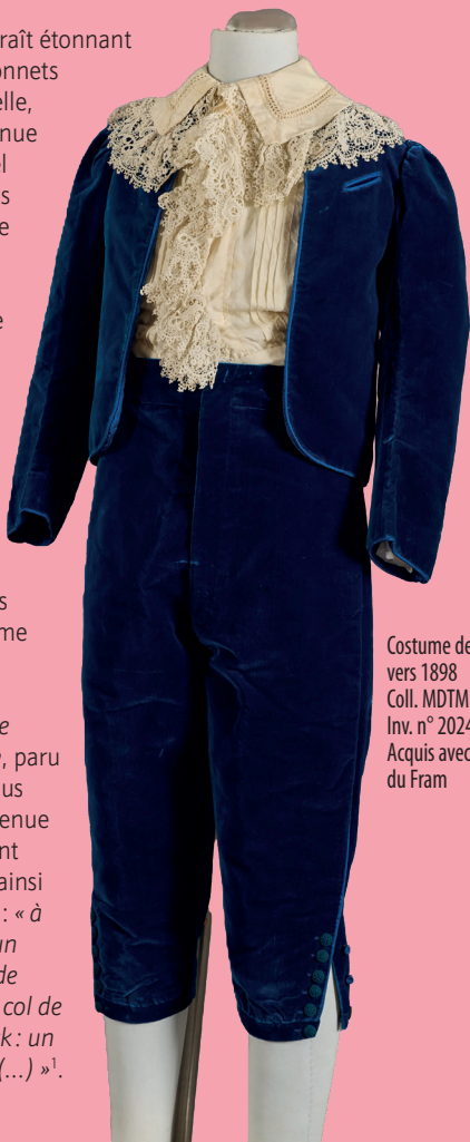
Costume de petit Lord, vers 1898 Inv. n° 2024.001.195 Acquis avec le concours du Fram