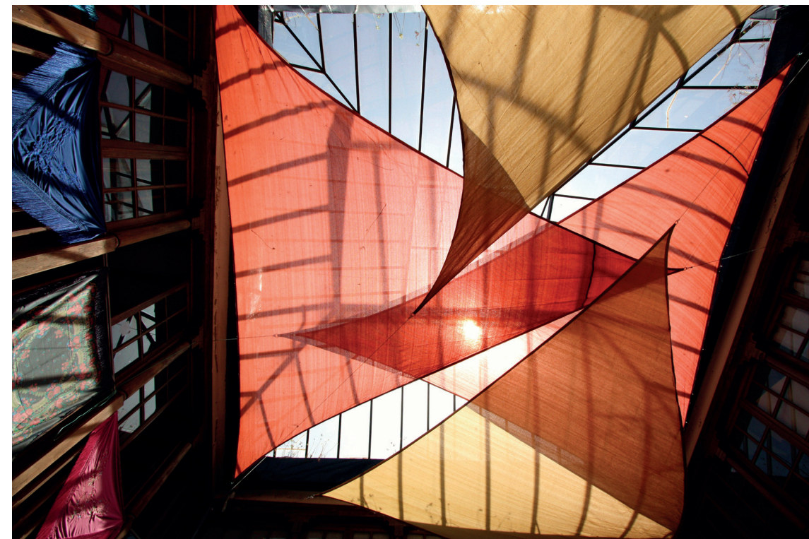
Ciel drapé de lumière est l'un des clichés exposés.