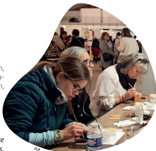
Le salon Mod'avenir permet de découvrir des métiers par le geste.

« Ces grandes maisons et ateliers du territoire seront mobilisés pour présenter leurs métiers, partager des témoignages et donner l'occasion de pratiquer par le geste. En touchant la matière, s'exerçant à la manipuler et la transformant en quelques minutes, les visiteurs auront ainsi l'opportunité d'explorer l'éventail des carrières offertes par le secteur et de s'immerger dans cet univers passionnant. Via ces activités, ils pourront mieux le comprendre et orienter leur choix, précise Nathalie Robin. Rappelons que dans les Pays de la Loire, les perspectives sont multiples dans cette industrie. De nombreux postes sont à pourvoir, souvent en lien avec la production, essentiellement en contrat à durée indéterminée. Couturiers, maroquins, piqueurs, etc., au masculin