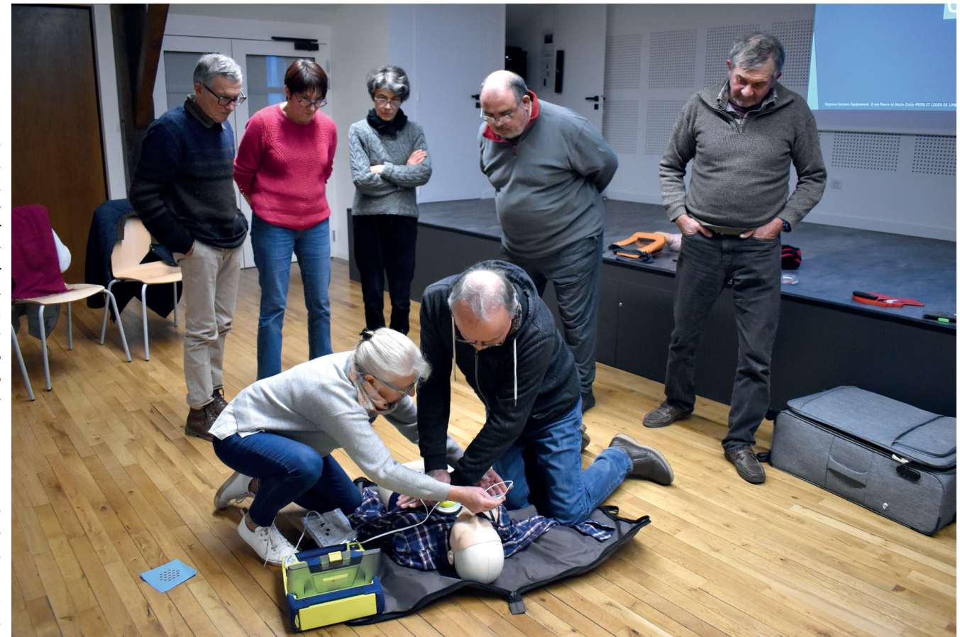
Une trentaine de Plainais ont été initiés aux gestes qui sauvent, notamment au massage cardiaque et à l'utilisation du défibrillateur automatisé externe.