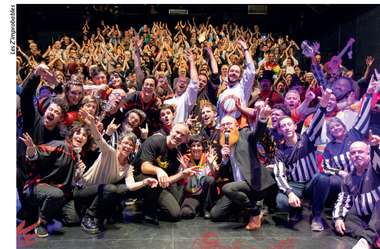
La troupe les Z'improbables.

Le principe ? Entourées de deux adjoints et d'un présentateur, deux équipes de quatre comédiens vont improviser en direct des saynètes d'une à dix minutes. Au public de donner un mot, une phrase ; à l'arbitre de lancer un thème. Les comédiens n'ont alors que quelques secondes de réflexion pour affûter leur imagination, puis quelques minutes pour transporter l'auditoire dans des histoires où tout est possible ! À l'issue de chaque saynète, le public vote afin de déterminer quelle équipe remporte le point. Alors, venez vivre l'ambiance d'un match sportif au théâtre, entre rires et moments d'émotions !