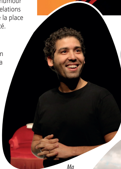
Ma république et moi