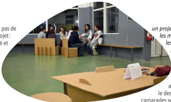
Les élèves ont présenté leur travail lors d'un défilé original.

Le carton ondulé à double cannelure, généreusement fourni par une entreprise de Loire-Atlantique, était le matériau parfait pour répondre à ces contraintes. Les enseignantes de poursuivre : « léger, facile à travailler mais vraiment robuste, il a permis de concevoir des meubles aisément transportables et démontables ». Un enjeu de taille, puisque les élèves ont montré le fruit de plusieurs