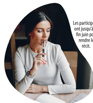
Les participants ont jusqu'à fin juin pour rendre leur récit.

Si l'imagination de chacun est de mise, chaque proposition, rédigée en français, doit obligatoirement se dérouler à Toutlemonde, ce qui constitue le thème imposé. Le texte doit bien entendu être inédit et original et les participants s'engagent sur l'honneur à ne pas utiliser l'intelligence artificielle.