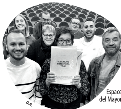
Espace del Mayor