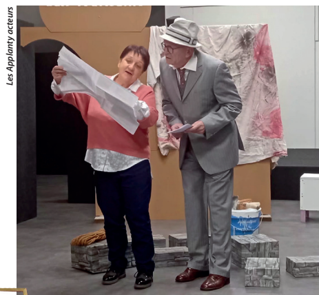
Les Applanty acteurs