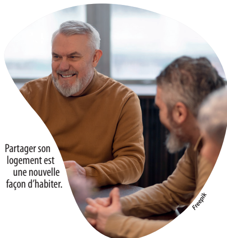
Partager son logement est une nouvelle façon d'habiter.

Plusieurs organismes présenteront le droit au logement et les aides à son adaptation ou aménagement. D'autres partageront leur expérience concrète comme HEP49 et son habitat participatif, Résidences habitat jeunes et son hébergement temporaire chez l'habitant dans le Vihierois ou Une maisonnée dans la ville, qui monte un projet d'habitat participatif à Cholet. Aussi, une initiation aux gestes de premiers secours sera donnée. La journée se terminera avec la pièce de