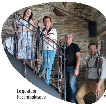
Le quatuor Rocambolesque