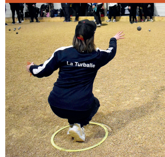
Le National de Cholet est l'un des derniers à proposer un concours féminin.

« À ce niveau-là, on ne peut pas parler de loisir »