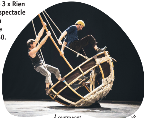
À contre vent

Deux regards, deux destins, une seule voie... Ils ont décidé de partir... Partir, c'est suivre le murmure du vent, ce souffle qui les pousse vers des horizons incertains où chaque lieu devient une nouvelle toile. L'exil, non pas une fin, mais une renaissance sous des cieux différents... On ne sait pas d'où ils viennent, ni où ils vont. Ce que nous savons, c'est qu'ils ont entrepris ce voyage ensemble, déterminés à avancer. Une danse vers l'inconnu... Sur scène, le duo d'acrobates touche du doigt l'équilibre fragile et puissant qui lie deux personnes. À travers cette quête commune vers l'inconnu, les circassiens mettent en exergue le caractère essentiel de la solidarité et de la fraternité. À contre vent apparaît donc comme une fable onirique où les personnages