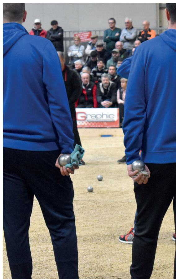
Plus de 4 000 joueurs vont en découdre sur les terrains de la Meilleraie et du bouldrome.