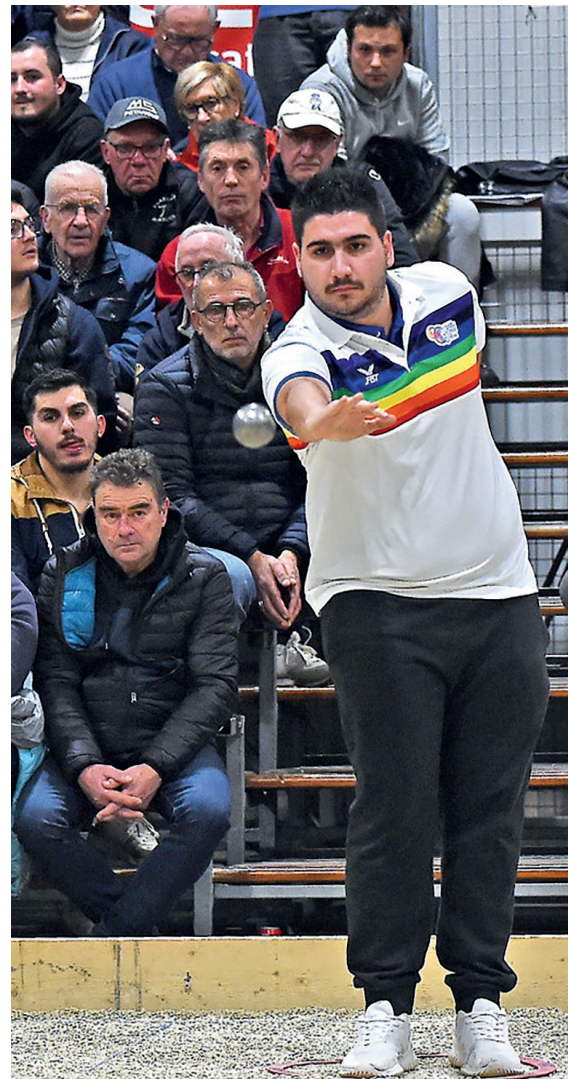
Les spectateurs se massent toujours en nombre, notamment dans le carré d'honneur, pour admirer le jeu des professionnels, comme ici Andrea Chiapello, champion du monde italien.