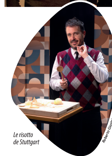
Le risotto de Stuttgart