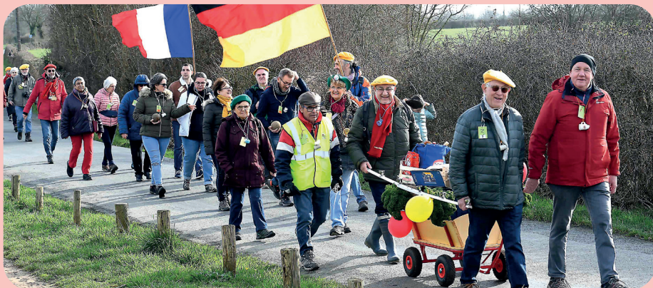
La Kohlfahrt est une tradition que l'on retrouve dans toute la région d'Oldenburg pendant la saison hivernale. La dernière édition à Cholet (photo ci-dessus) remonte à 2024.

l'association Cholet France Allemagne qui n'existait pas encore, prend la route en direction de l'autre côté du Rhin pour la première fois : « nous étions très nombreux à partir. Je me souviens que pour ce premier voyage, 18 cars étaient remplis, avec des membres d'associations de musique, de sport et de théâtre et sur place, nous étions accueillis dans les familles oldenbourgeoises. » C'est en 1998 que ladite association, chargée de renforcer et maintenir