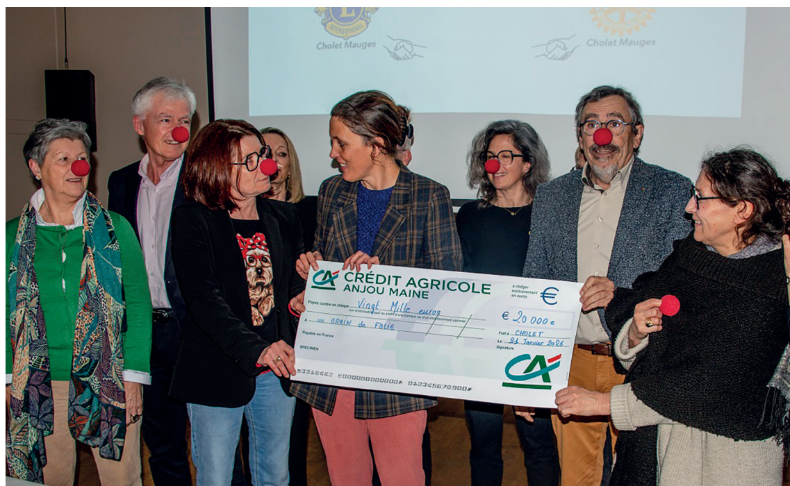
Association des clubs service

Une fondation pourrait désormais permettre la poursuite de ce projet, riche pour les enfants hospitalisés et leur famille.