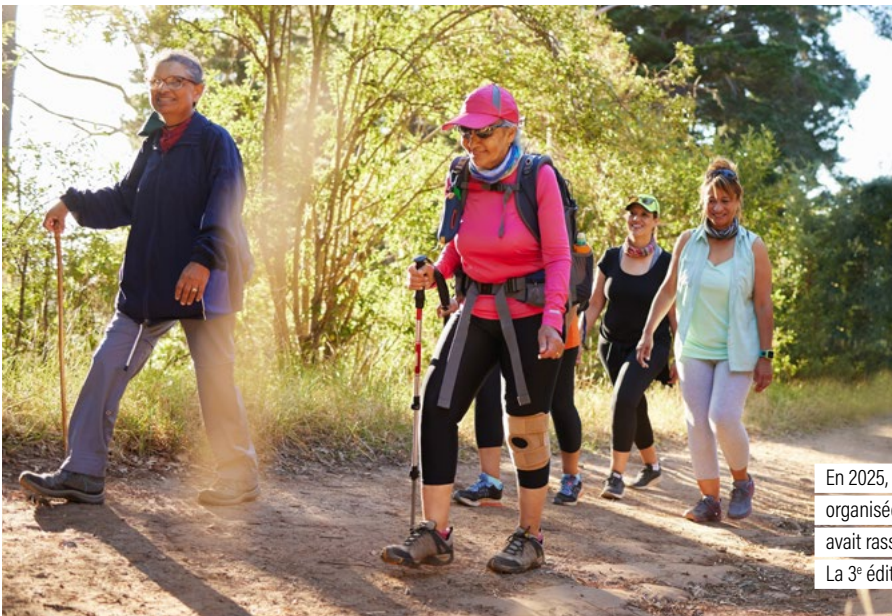
En 2025, la marche solidaire contre le cancer, organisée par les Lions Clubs de Cholet avait rassemblé 250 participants. La 3 e édition est prévue dimanche 7 juin.