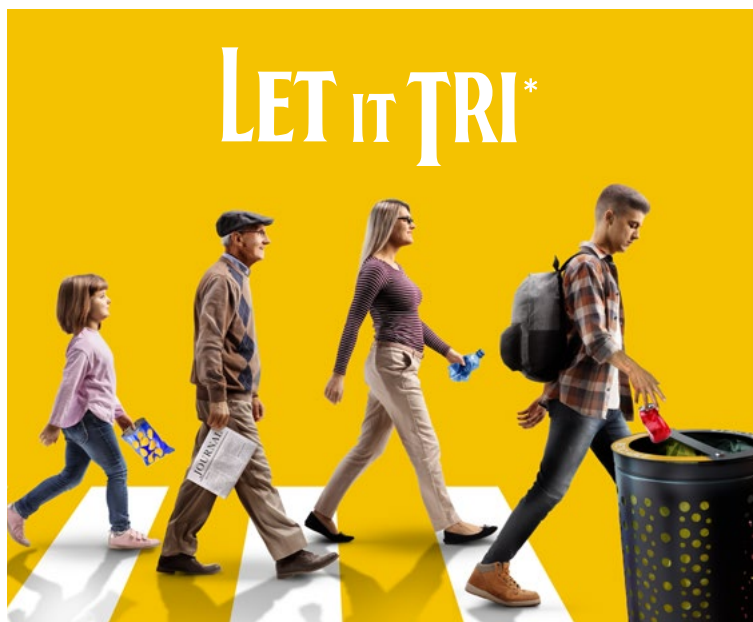
Direction de la Communication - Cholet, Ville et Agglomération - Visuels : Shutterstock *Triçons tous

À travers cette démarche, l'Agglomération souhaite faire du tri dans l'espace public un automatisme. Elle prévoit également lors des manifestations, des événements culturels ou sportifs de mettre à disposition des usagers des corbeilles. ■